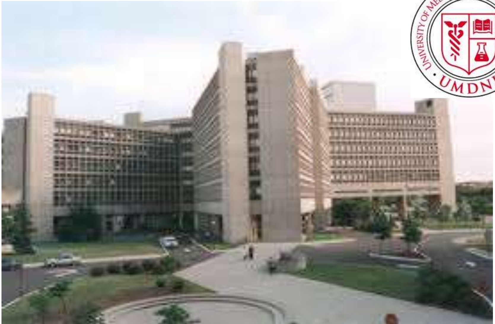
University of Medicine and Dentistry of New Jersey: 1980-1982 Newark, NJ. Especialidad en Enfermedades Infecciosas