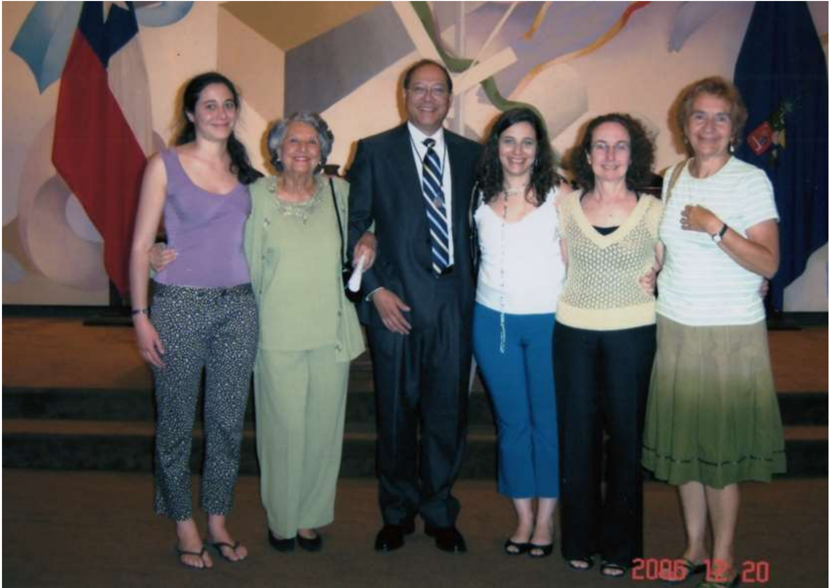
Ceremonia nombramiento Profesor titular Universidad de Chile