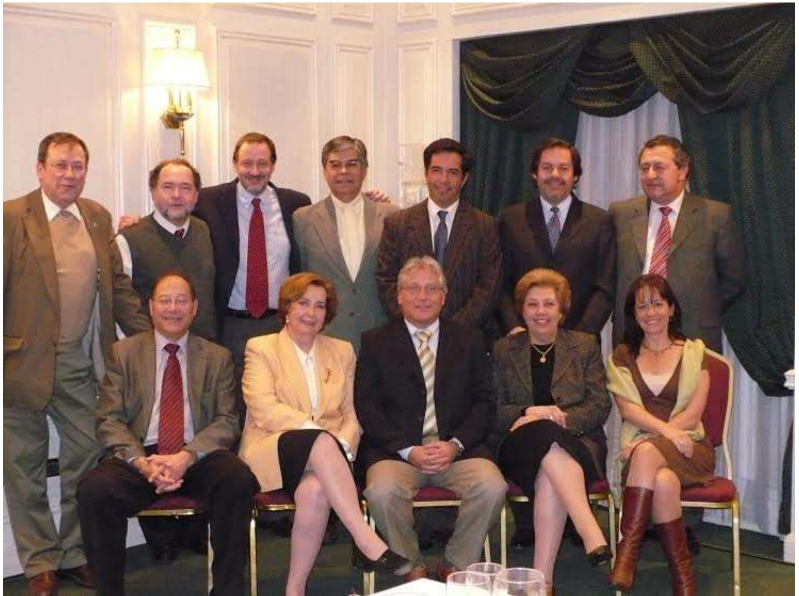
1983, socio fundador Sociedad Chilena de infectología