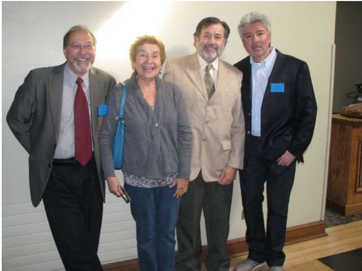
Unidad de Infectología Hospital Paula Jaraquemada (Ahora San Borja Arriarán) Previo a la creación de Fundación Arriarán