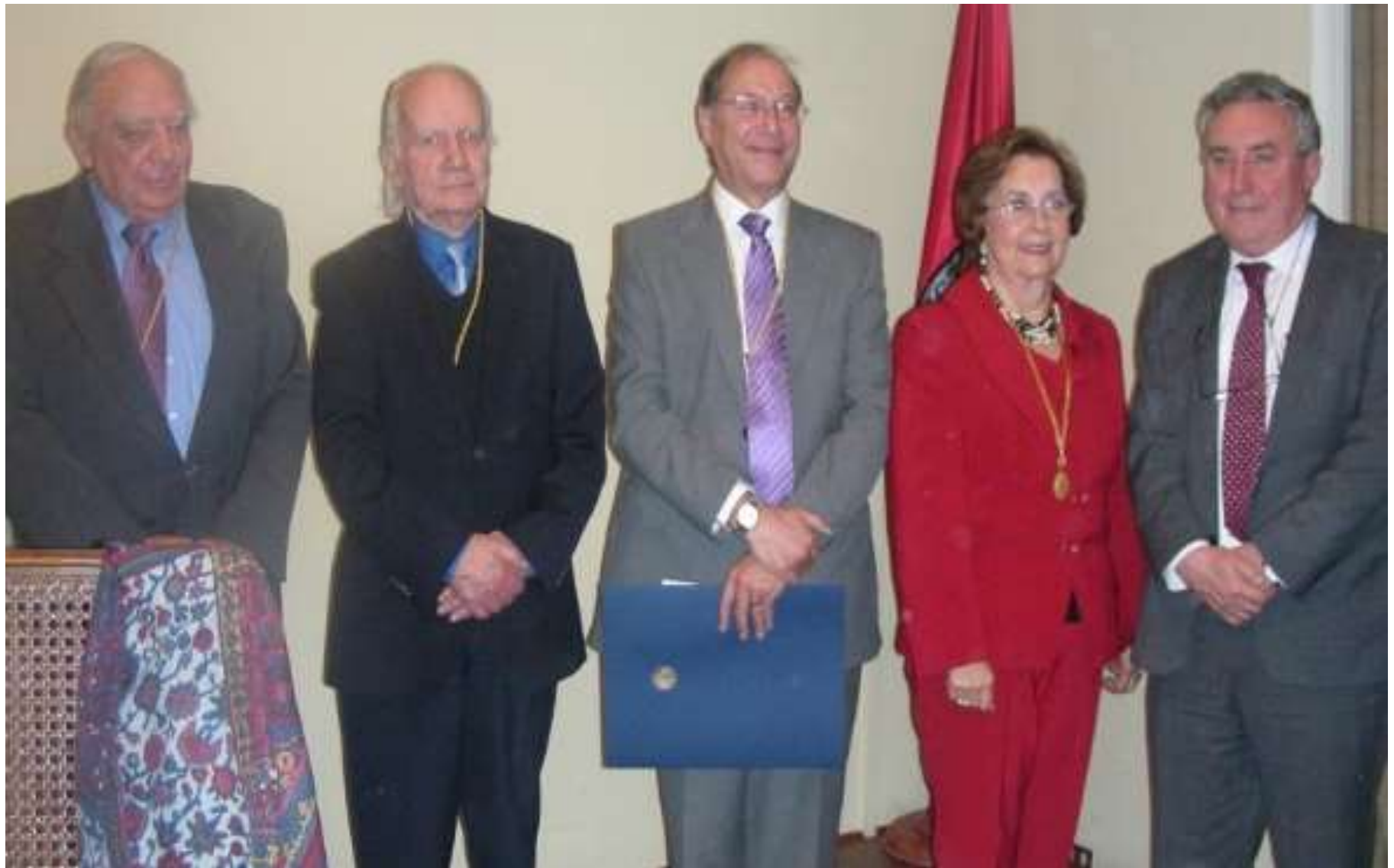
Ceremonia de incorporación Academia de Medicina, 2014